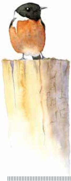
←← Tartre père